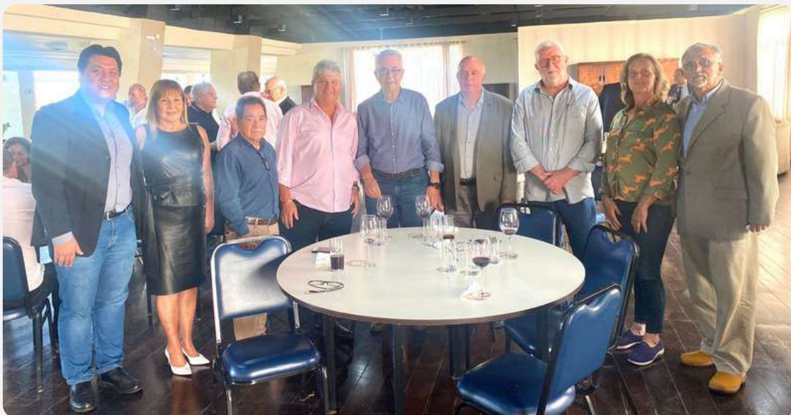
Posse da nova Diretoria do Jóquei Clube do Paraná