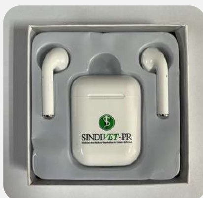
FONE DE OUVIDO