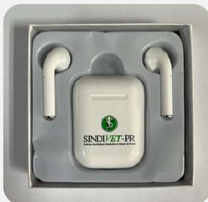
FONE DE OUVIDO