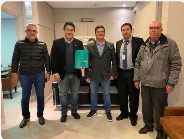
Giro de relacionamento político, apresentando a nossa classe, com foco principal na educação da medicina veterinária. Presentes SINDIVET-PR, CRMV-PR e FECLAMEV.