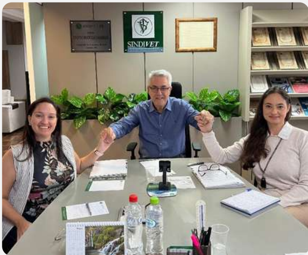
Tratativas Proposta de interiorização dos cursos no Estado do Paraná com empresa SOLUVISA