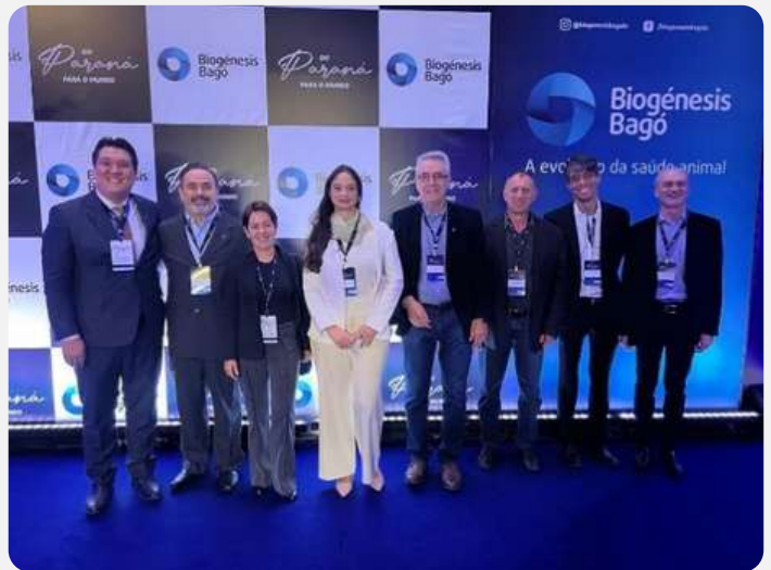
Inauguração da Fábrica da Biogénesis Bagó em Campo Largo