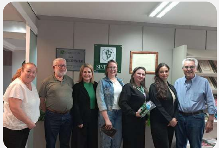
Retomada de negociações RCP/UNIMED;